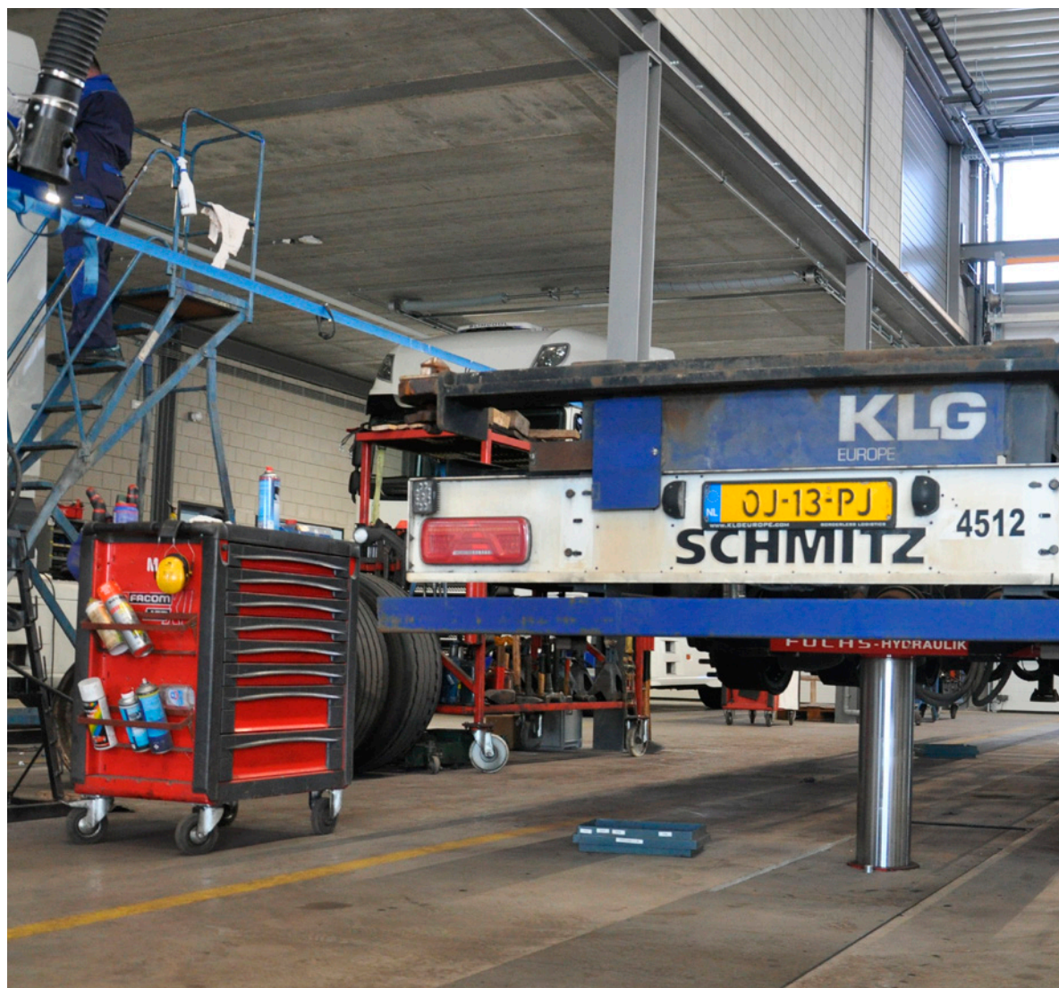
Wielvrij-heffen dankzij de Fuchs stempelbrug: ideaal voor bandenwissels, werk aan de ophanging of remmen.

lers tegelijk te werken. De twee putten zijn in het werk gestort en flankeren een tussengelegen kelder waarin de bulk tanks staan voor nieuwe en afgewerkte olie. Een snelle blik wekt de indruk dat beide straten voorzien zijn van remmentestbank met spelingsdetector, maar de eerste put heeft er bij nadere blik toch geen. De springen zijn voorbereid voor een mogelijke toekomstige bank met spelingsdetector zodat er dan geen ingewikkeld grondwerk meer gedaan hoeft te worden.