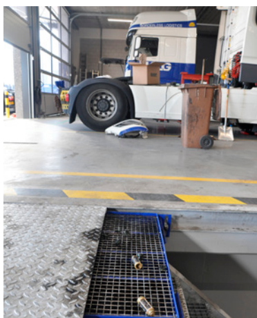
De olie-opvangbak in de put laat zien dat over elk detail is nagedacht.